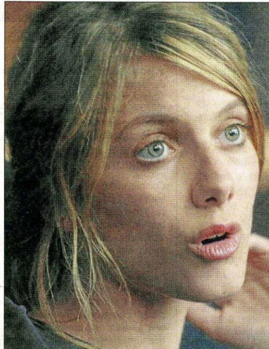
Mélanie Laurent et Claude Lelouch seront parmi les célébrités présentes à Arras du 4 au 13 novembre.